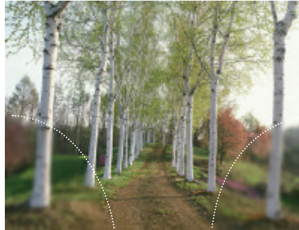
Lente progresiva convencional