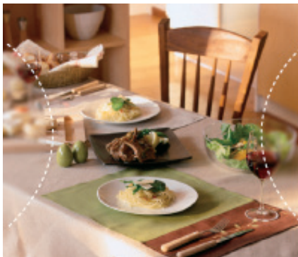
Lente progresiva convencional