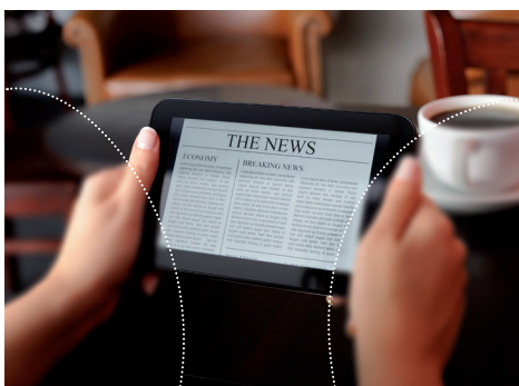
Lente progresiva convenciona

Gracias al diseño cuadrado, somos capaces de obtener una amplia zona de visión de cerca. Además, mediante la adaptación del inset de acuerdo con los parámetros apropiados y mediante la optimización de la curva frontal de cada ojo, el campo de visión es aún más cómodo