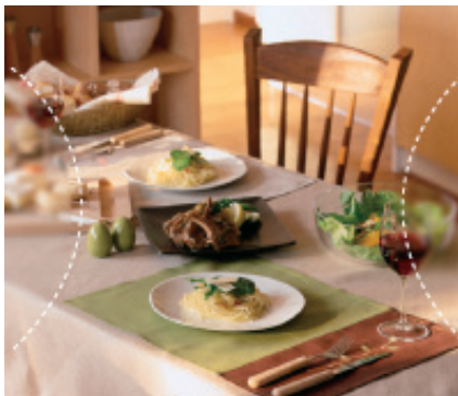
Conventioneel progressief glas